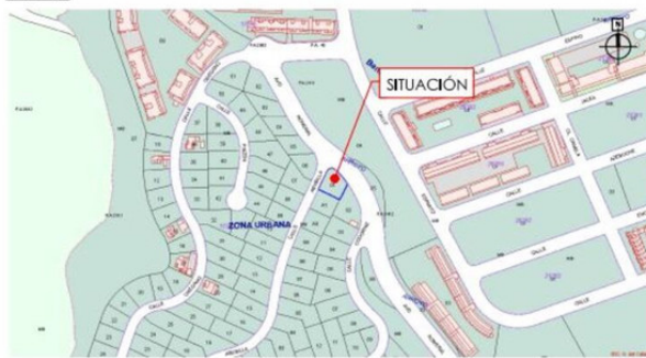
SITUACIÓN Vista de Pájaro Parcela N° 120