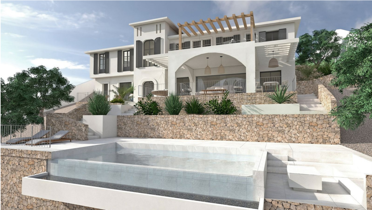
La Cala Golf