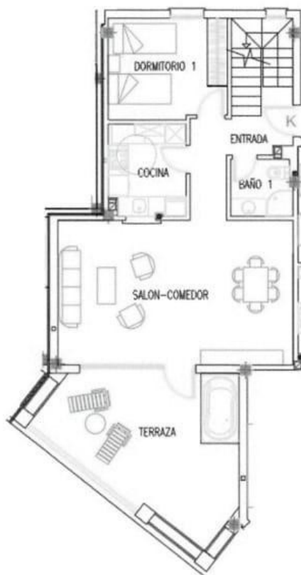
NIVEL QUINTO DUPLEX TIPO K