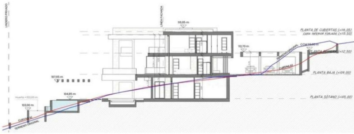
Sección Transversal 2

VIVIENDA UNIFAMILIAR Y PISCINA URB. "HACIENDA LAS CHAPAS", PARCELA 259. MARBELLA