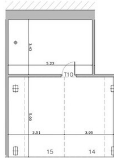
APARCAMIENTOS Y TRASTERO