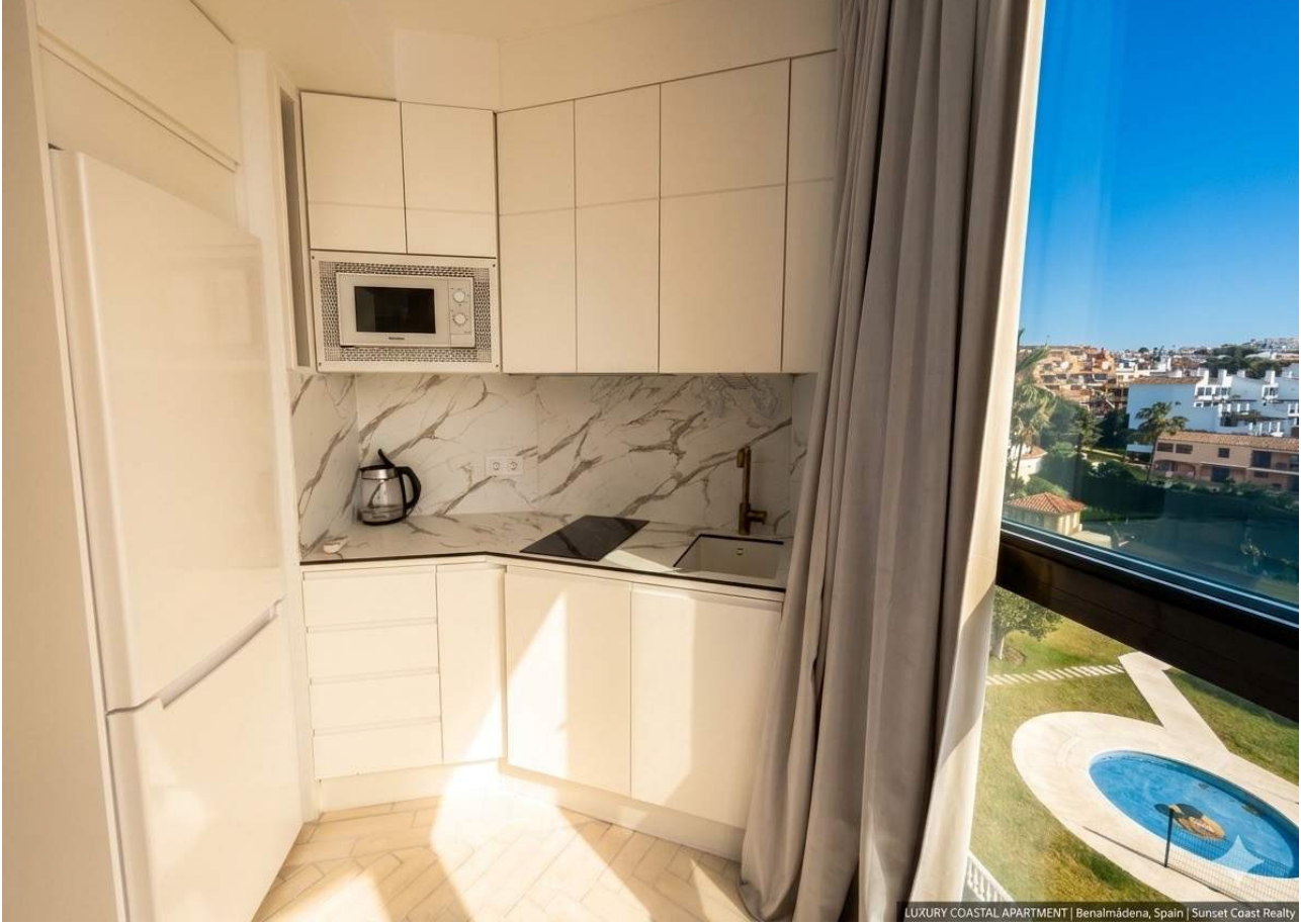
LUXURY COASTAL APARTMENT | Benalmádena, Spain | Sunset Coast Realty