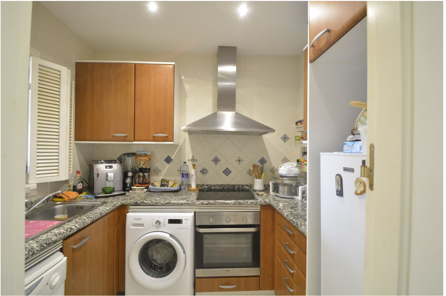
REFORMA VIRTUAL- VIRTUAL HOME STAGING