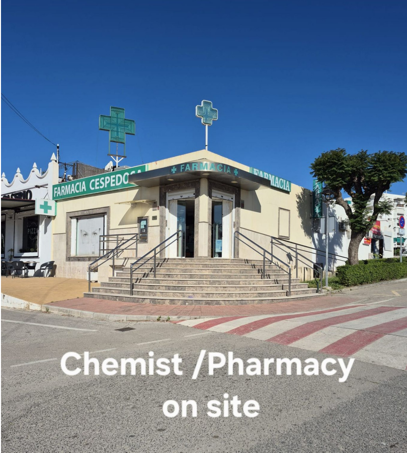
Chemist /Pharmacy on site