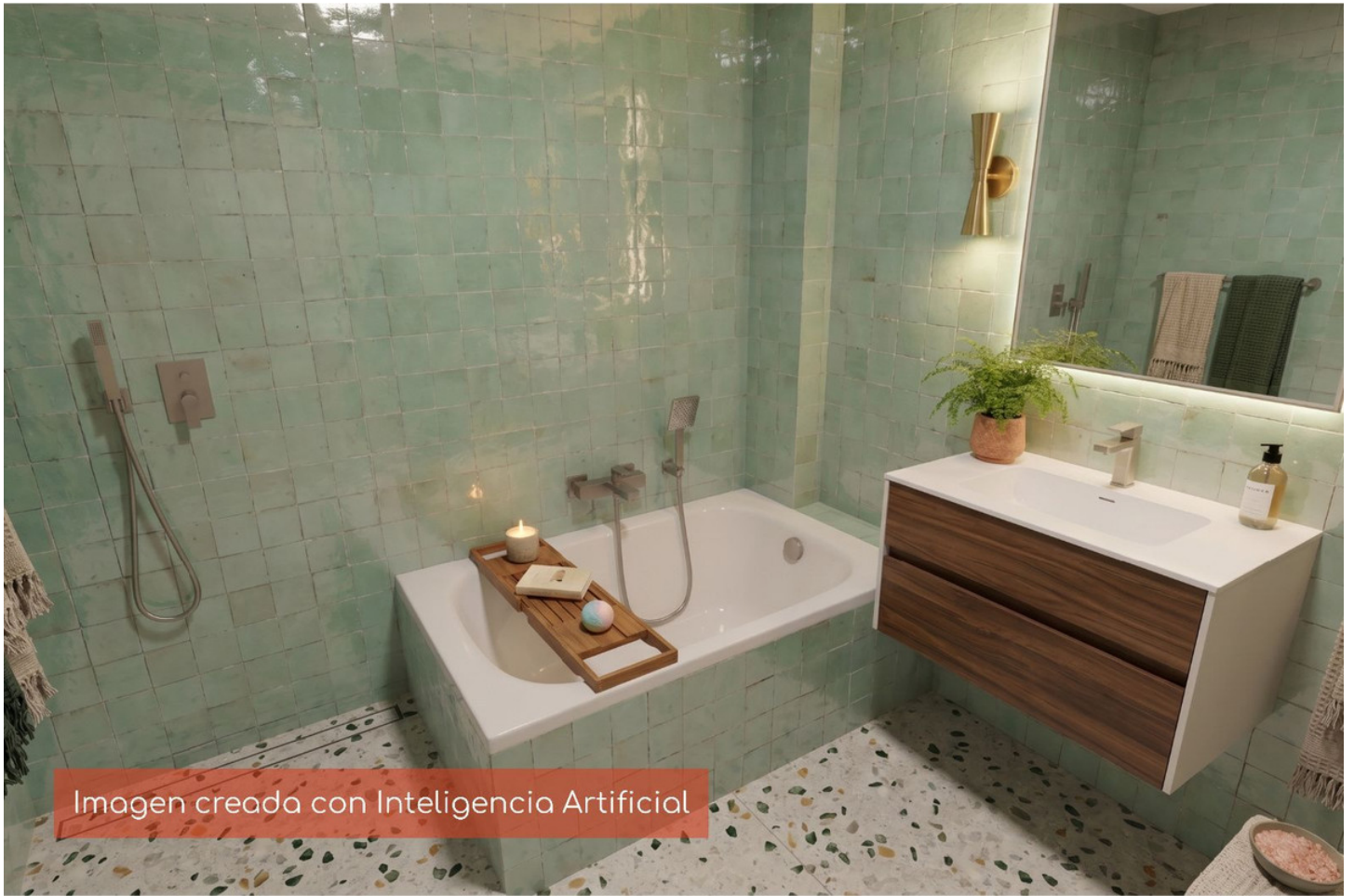
Imagen creada con Inteligencia Artificial