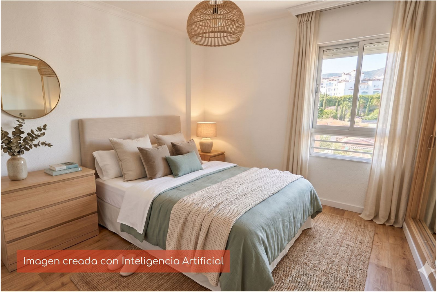
Imagen creada con Inteligencia Artificial