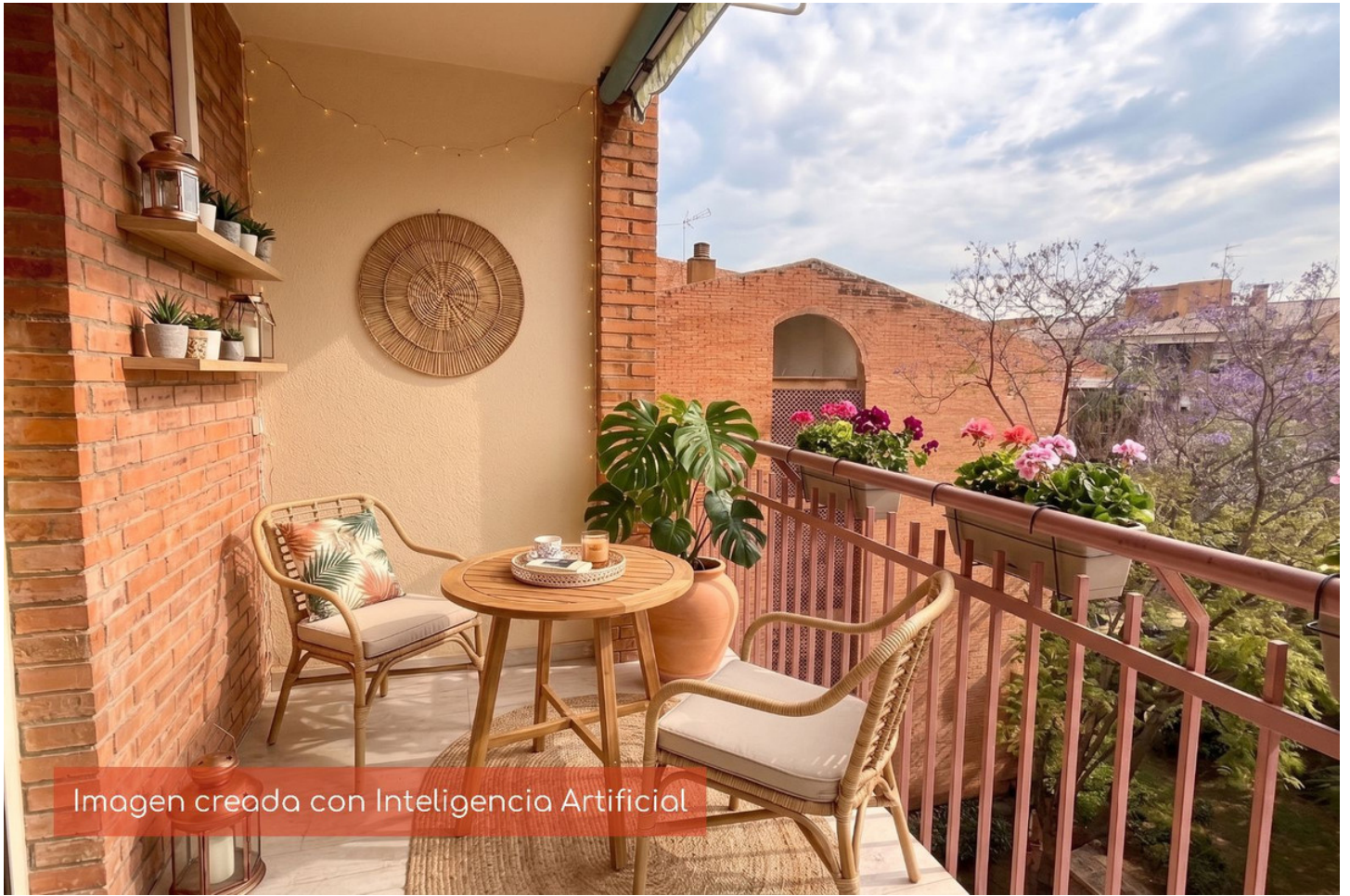
Imagen creada con Inteligencia Artificial