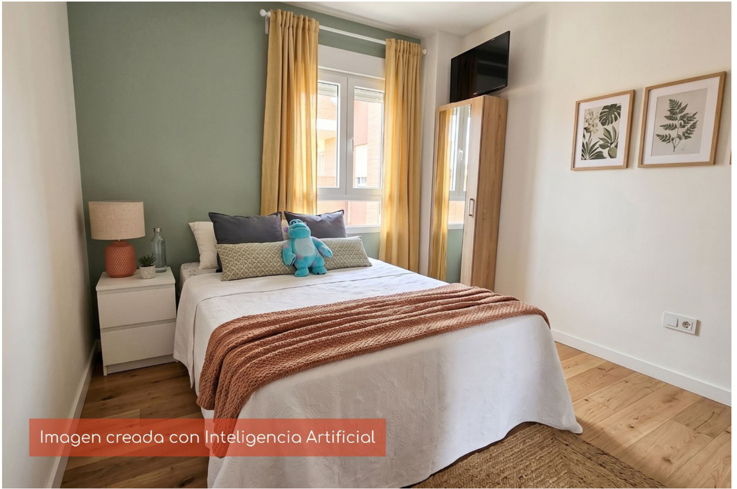
Imagen creada con Inteligencia Artificial