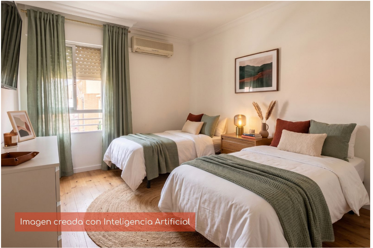
Imagen creada con Inteligencia Artificial