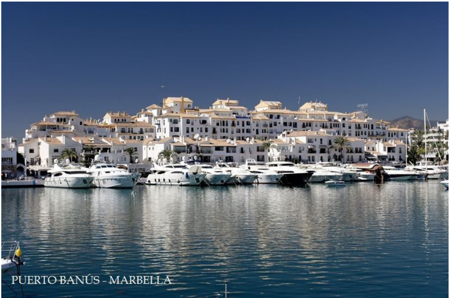
PUERTO BANÚS - MARBELLA