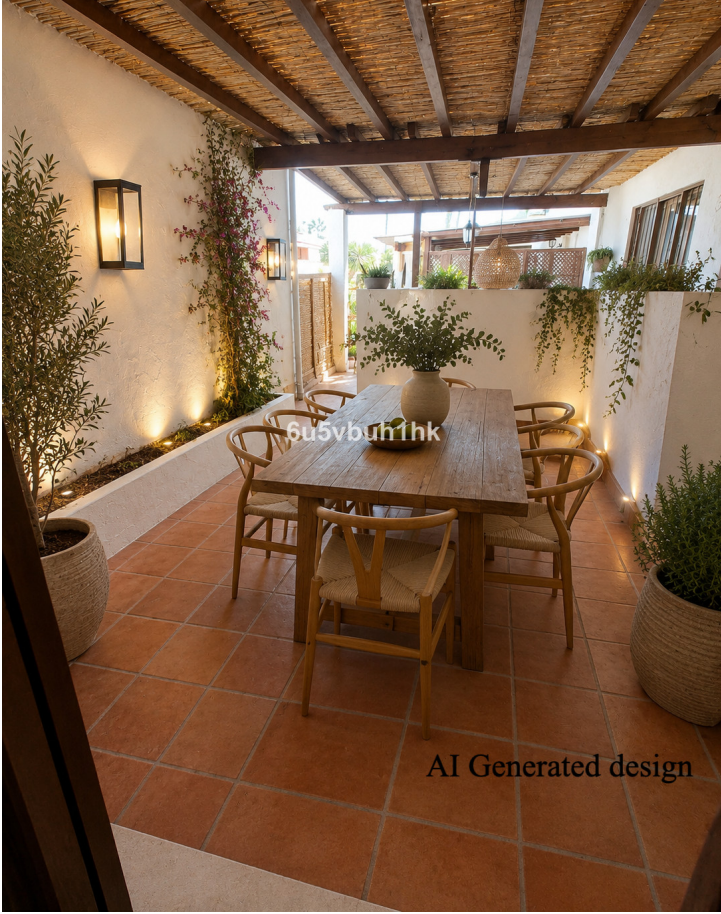
AI Generated design