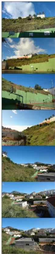
ZONIFICACION Y USOS DE LAS SUBPARCELAS EXISTENTES