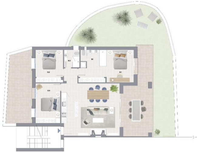
PLANTA BAJA BLOQUE 29 APARTAMENTO 2 VIVIENDA TIPO 'A' MEDIANERA