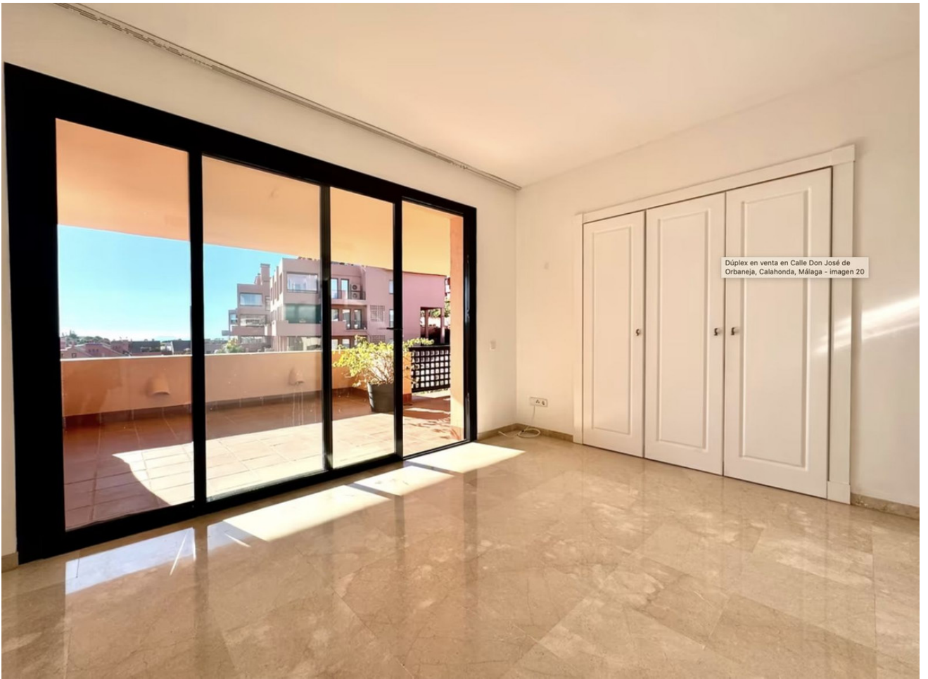
Dúplex en venta en Calle Don José de Orbaneja, Calahonda, Málaga - imagen 20