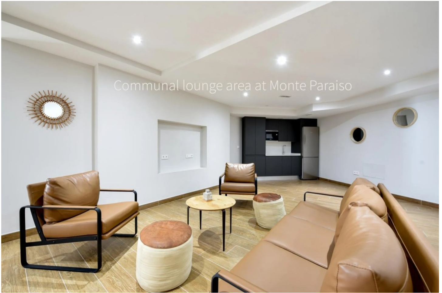
Communal lounge area at Monte Paraiso