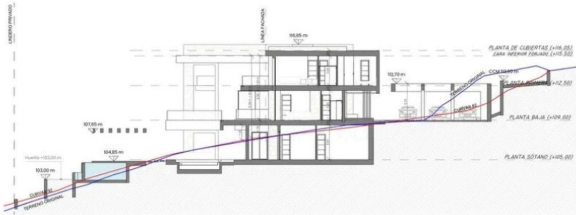
Sección Transversal 2