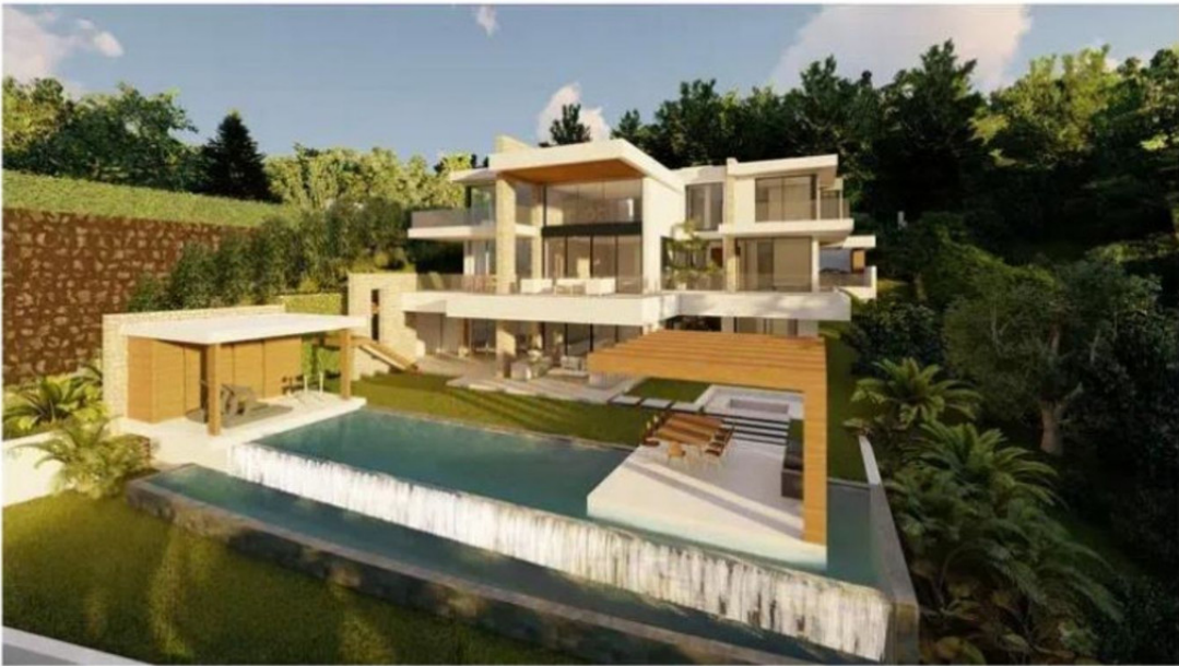
VIVIENDA UNIFAMILIAR Y PISCINA

URB. "HACIENDA LAS CHAPAS". PARCELA 259. MARBELLA