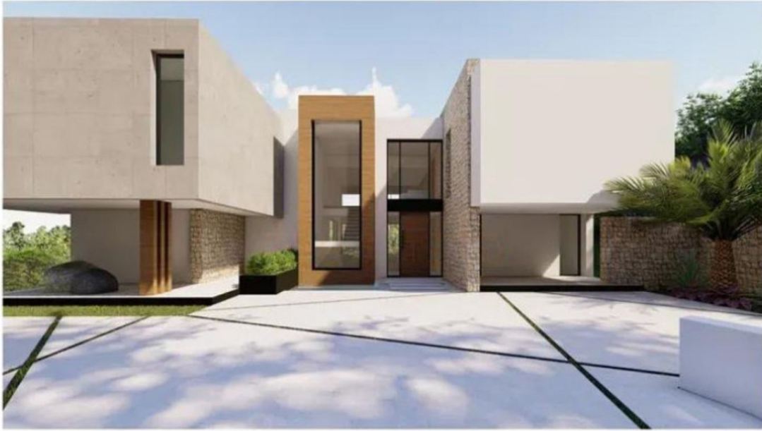
VIVIENDA UNIFAMILIAR Y PISCINA

URB. "HACIENDA LAS CHAPAS". PARCELA 259. MARBELLA