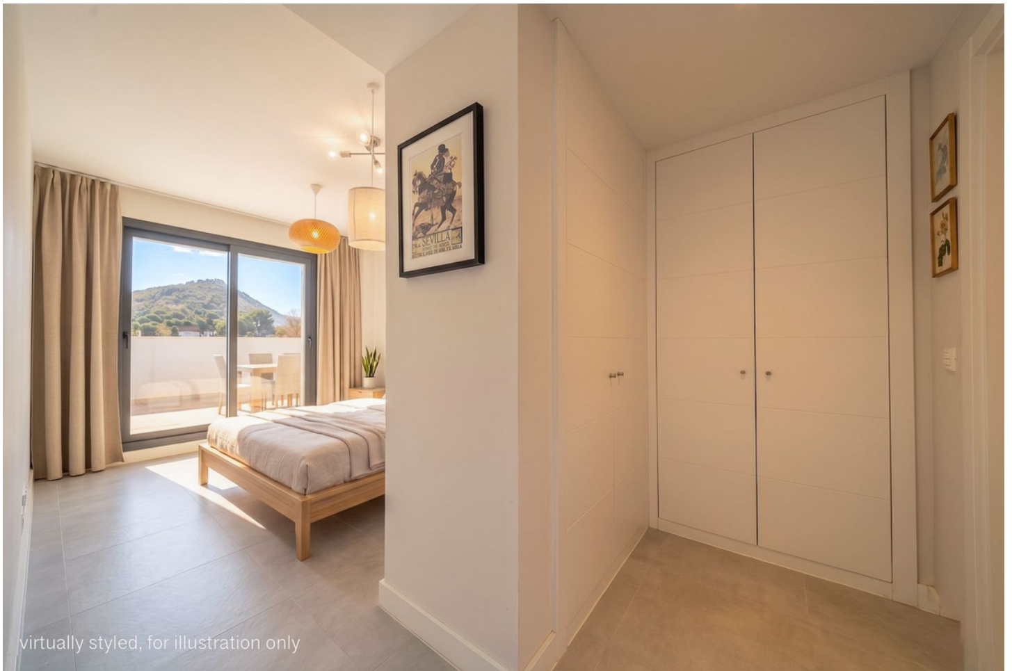
virtually styled, for illustration only