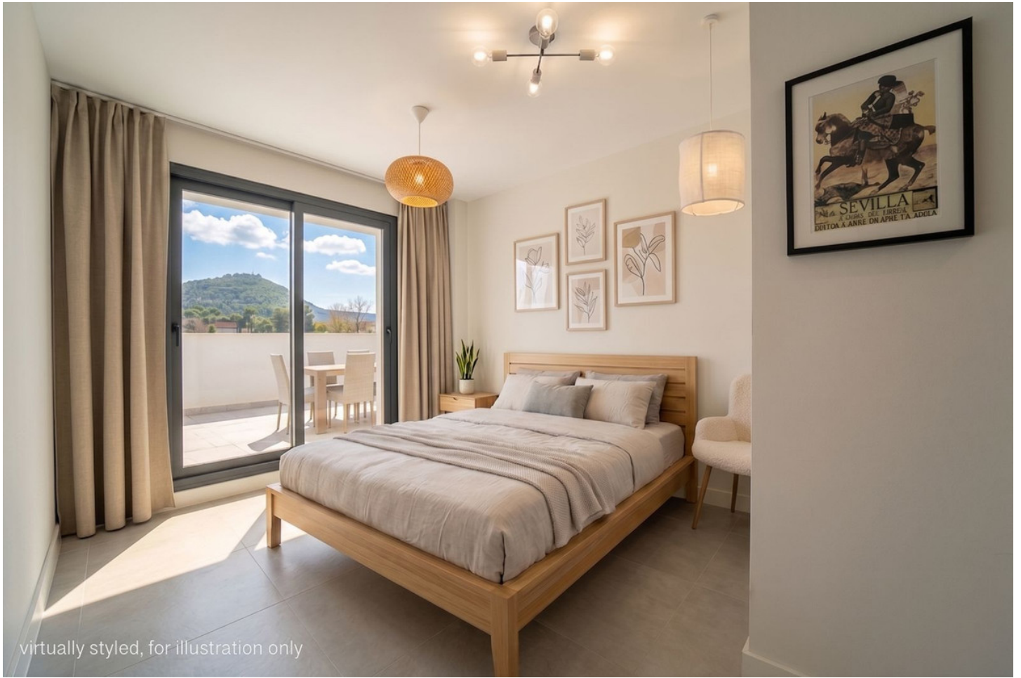
virtually styled, for illustration only