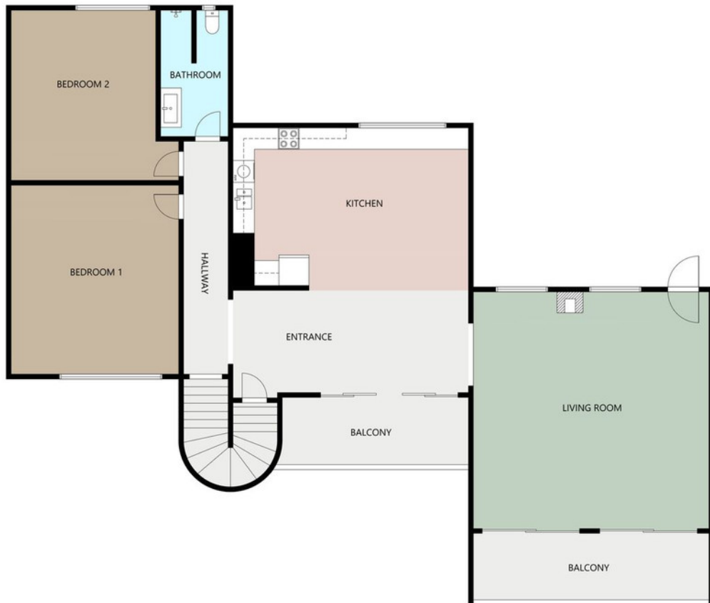
UPPER LEVEL 1