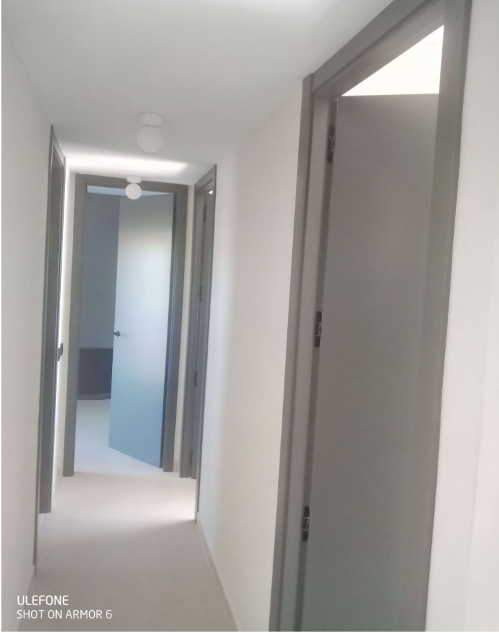
ULEFONE SHOT ON ARMOR 6