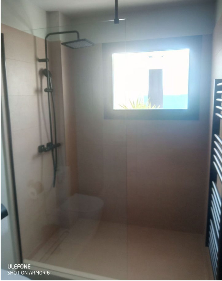
ULEFONE SHOT ON ARMOR 6