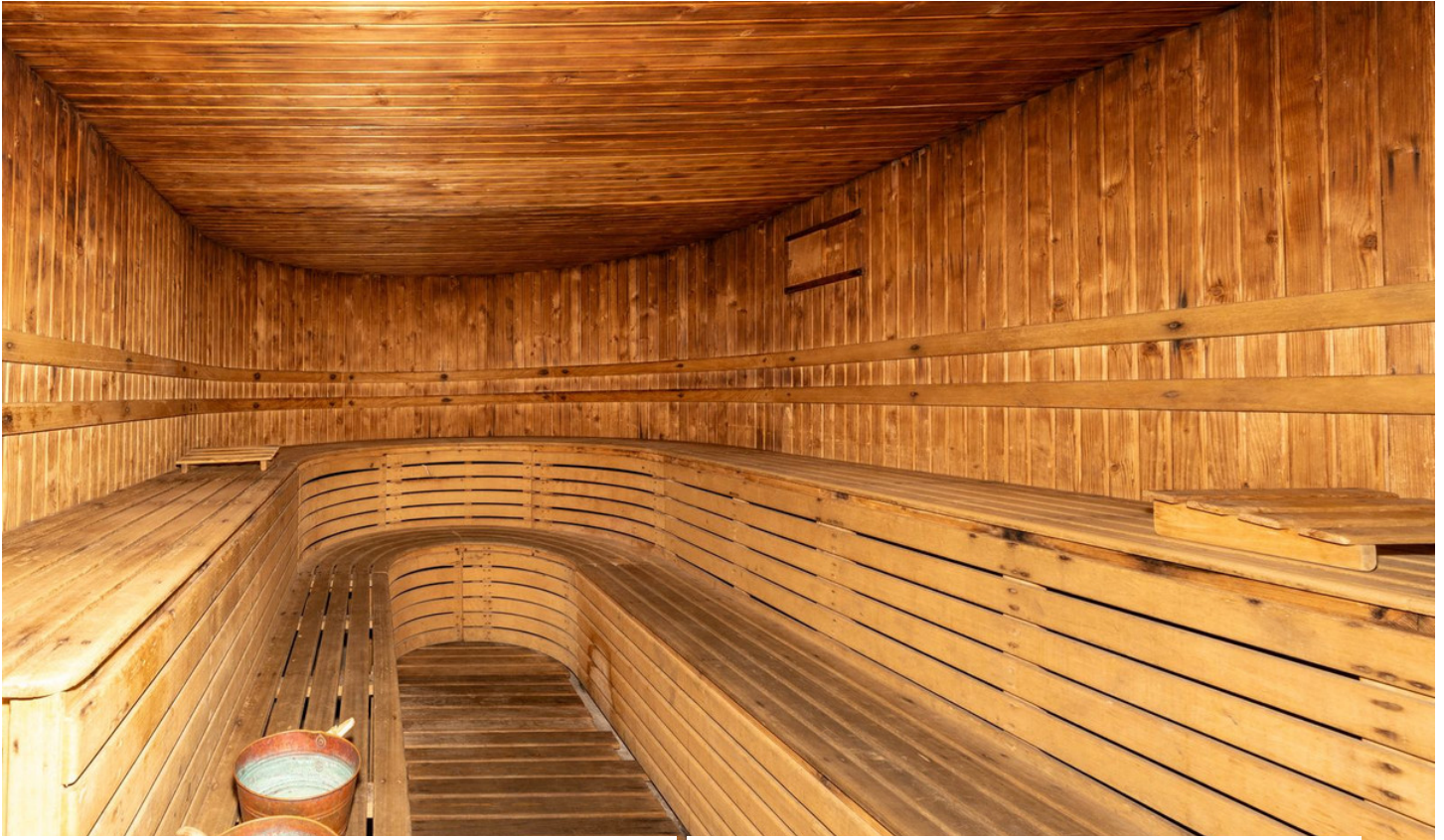
EDIF. MARBELLA HOUSE. ATICO 101. 18/01/2022