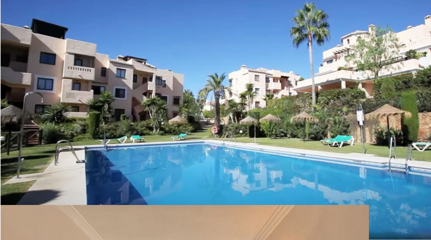
El Manantial de Santa Maria Golf - Elviria - Marbella