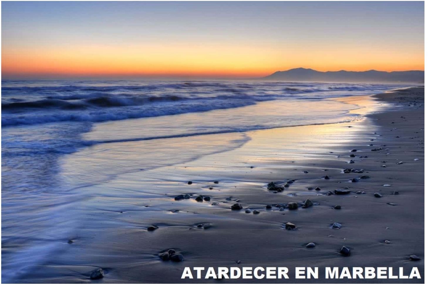
ATARDECER EN MARBELLA