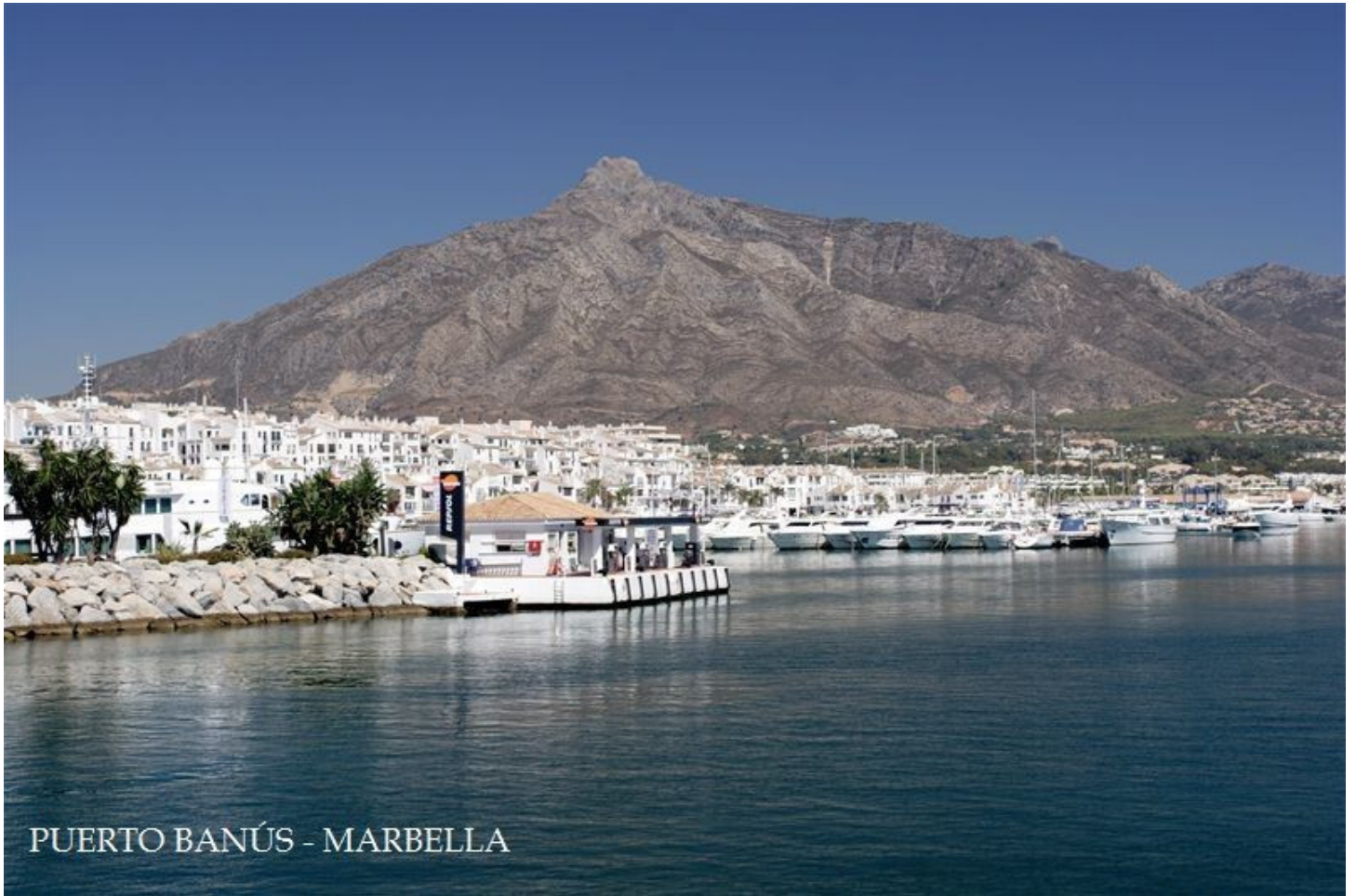
PUERTO BANÚS - MARBELLA