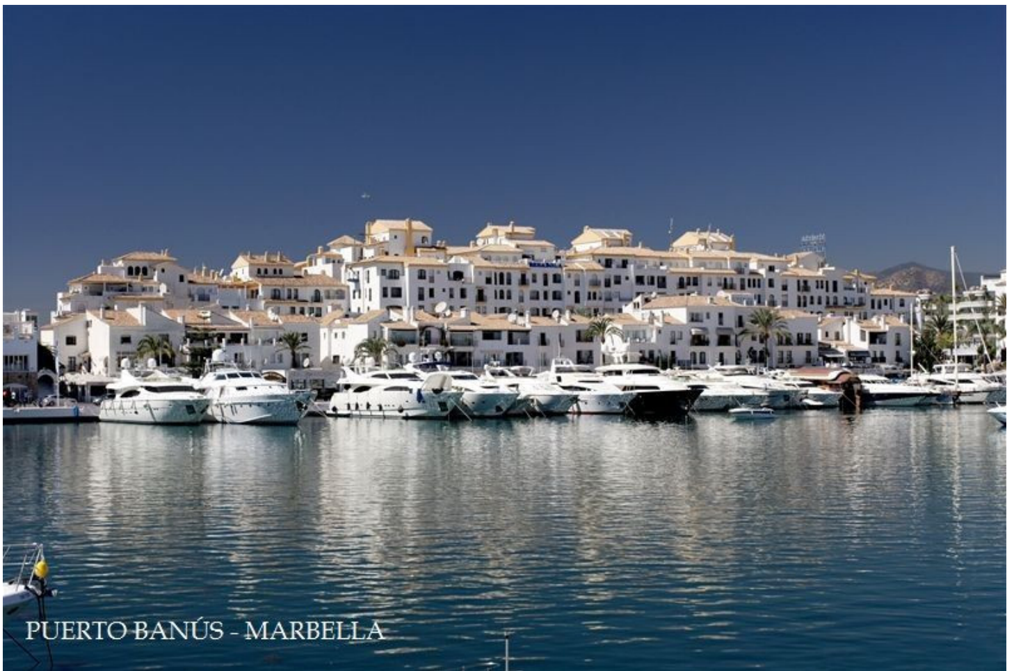
PUERTO BANÚS - MARBELLA