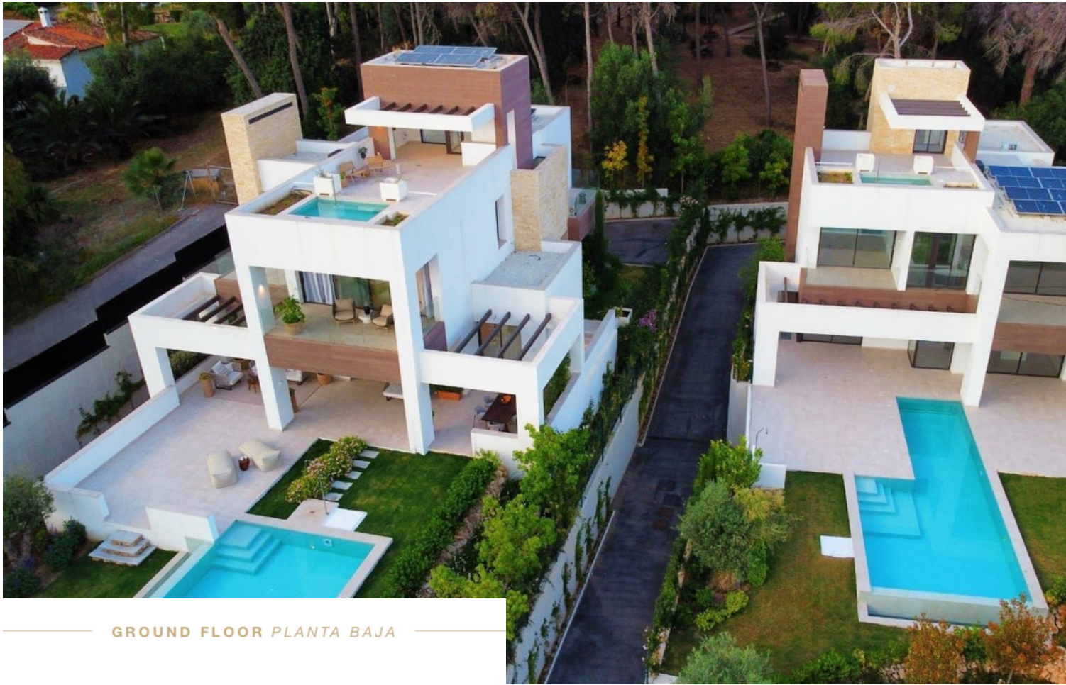
GROUND FLOOR PLANTA BAJA