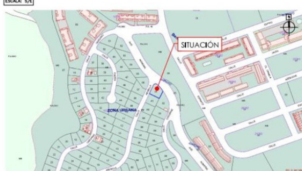
SITUACIÓN Vista de Pájaro Parcela N° 120