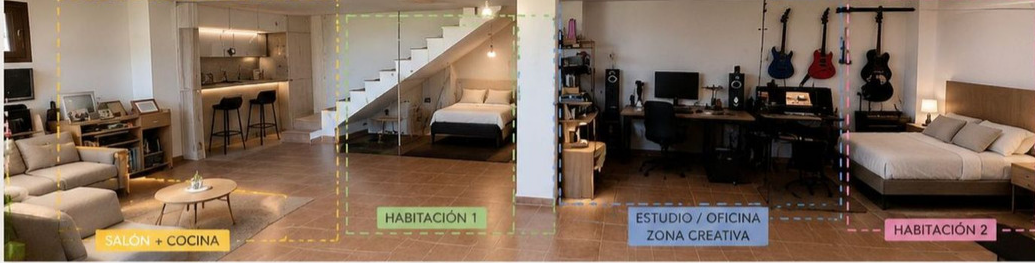
SALÓN + COCINA