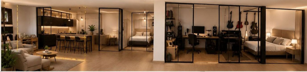
OPCIÓN 1: LOFT + 2 HABITACIONES + ESTUDIO